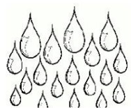
КОНТРАСТНОЕ ОБЛИВАНИЕ НОГ