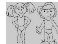
ГИМНАСТИКА ПОСЛЕ СНА