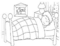
СОН БЕЗ МАЕК