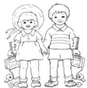
ЗАНЯТИЯ НА СВЕЖЕМ ВОЗДУХЕ